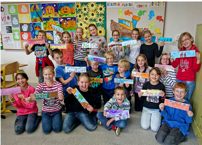
Záložky do knih