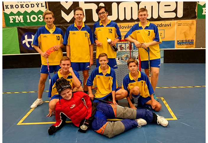
Florbalový turnaj SBOŠ